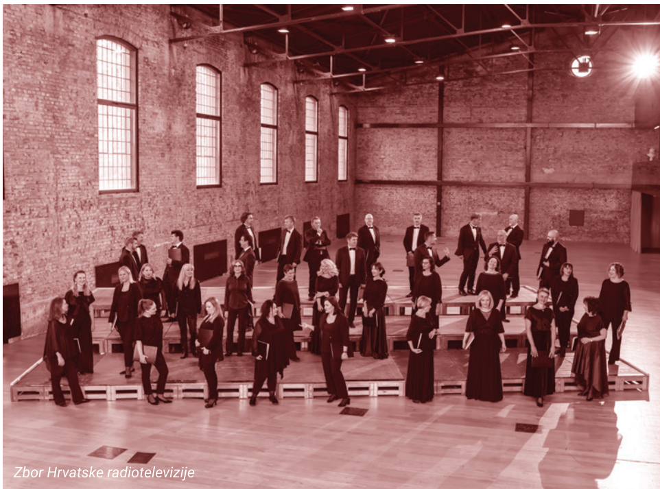
Zbor Hrvatske radiotelevizije