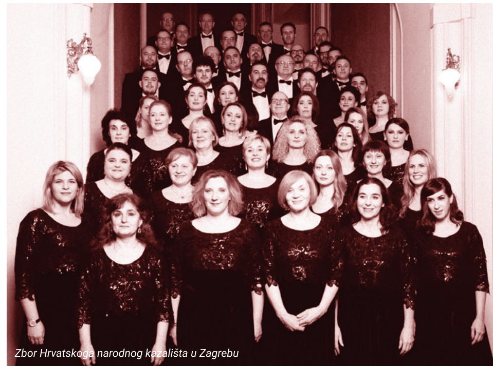
Zbor Hrvatskoga narodnog kazališta u Zagrebu

Utemeljenjem stalne Opere u Zagrebu, osnovan je 1870. godine, u vrijeme ravnateljstva Ivana pl. Zajca, i stalni operni zbor. Zbor je u to vrijeme imao 13 muških i 13 ženskih članova, a danas Zbor Hrvatskoga narodnog kazališta u Zagrebu ima 33 pjevačice i 33 pjevača. Od samih početaka sudjelovao je u opernim, ali i u operetnim predstavama koje su se davale u matičnoj zgradi i u Malom kazalištu na Tuškancu. Iako je Opera imala prekida u svojem djelovanju, repertoar se održavao povremenim nastupima, tako da se razvijao i operni zbor. Tijekom desetljeća Zbor je sudjelovao u brojnim opernim izvedbama koje tvore golem opus u kojem su zastupljena gotovo sva svjetska i domaća operna djela te brojne domaće