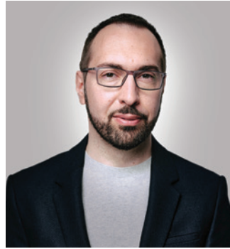
TOMISLAV TOMAŠEVIĆ gradonačelnik Grada Zagreba

U povodu obilježavanja 50. rođendana Koncertne dvorane Vatroslava Lisinskog, svim njezinim djelatnicima i njezinoj vjernoj publici čestitam veliki jubilej sa željom da nam još dugo bude mjestom održavanja velikih koncerata i izvedbi bogatih umjetničkih programa ukorak s najnovijim umjetničkim trendovima!