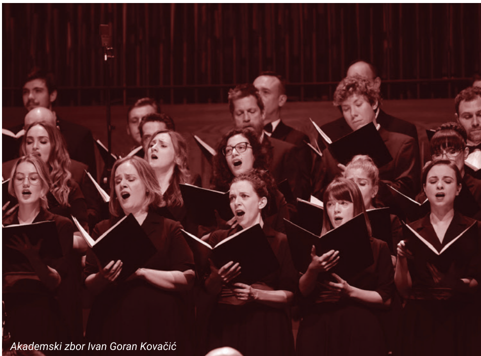
Akademski zbor Ivan Goran Kovačić