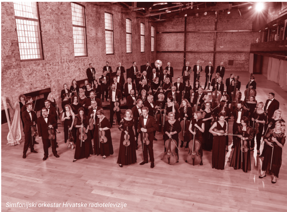
Simfonijski orkestar Hrvatske radiotelevizije